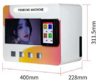
4 Puntos recogida